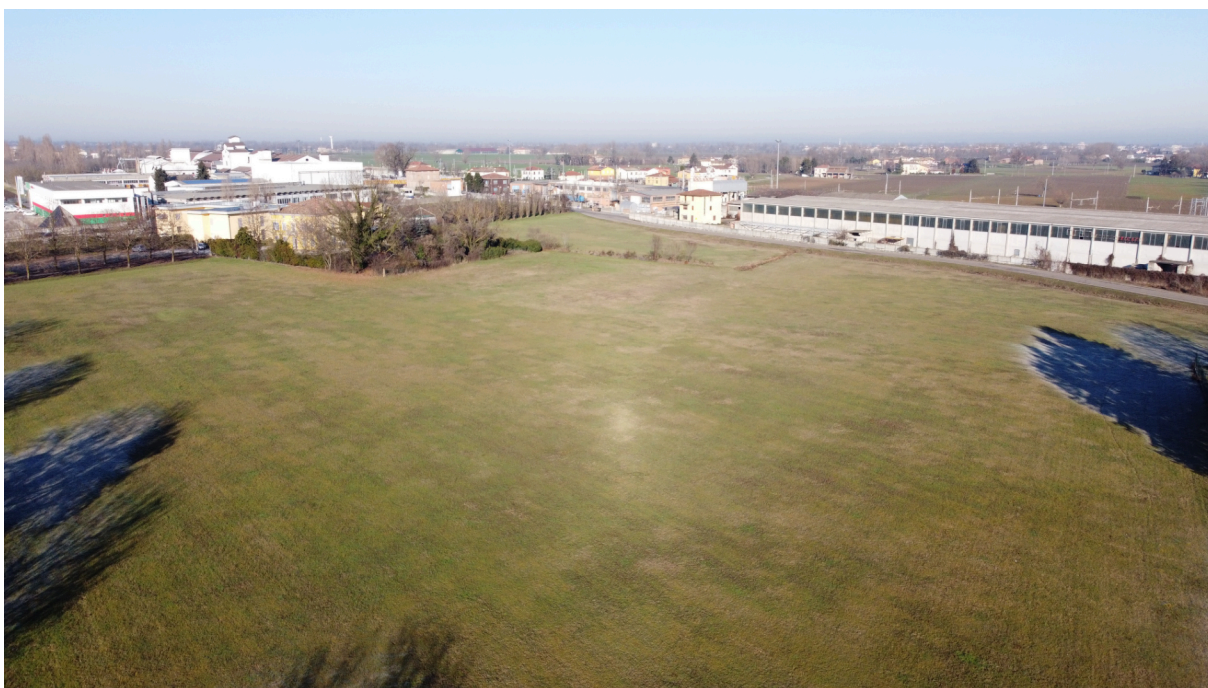
Foto aerea da sud/est