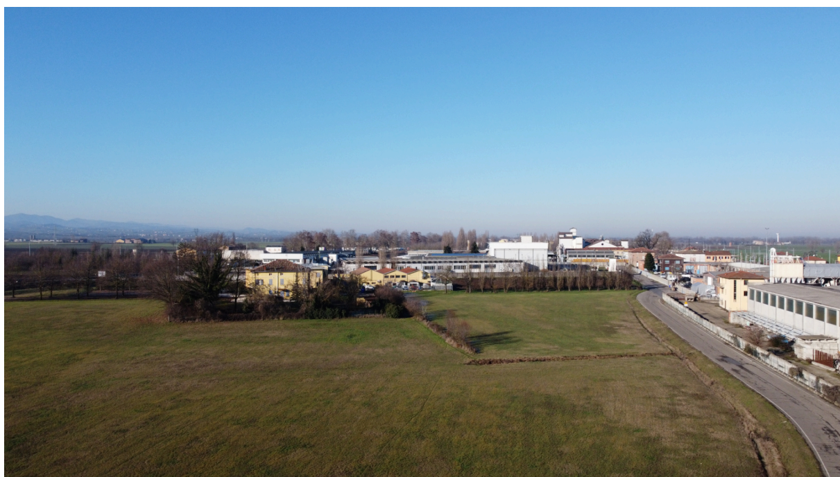
Foto aerea da est