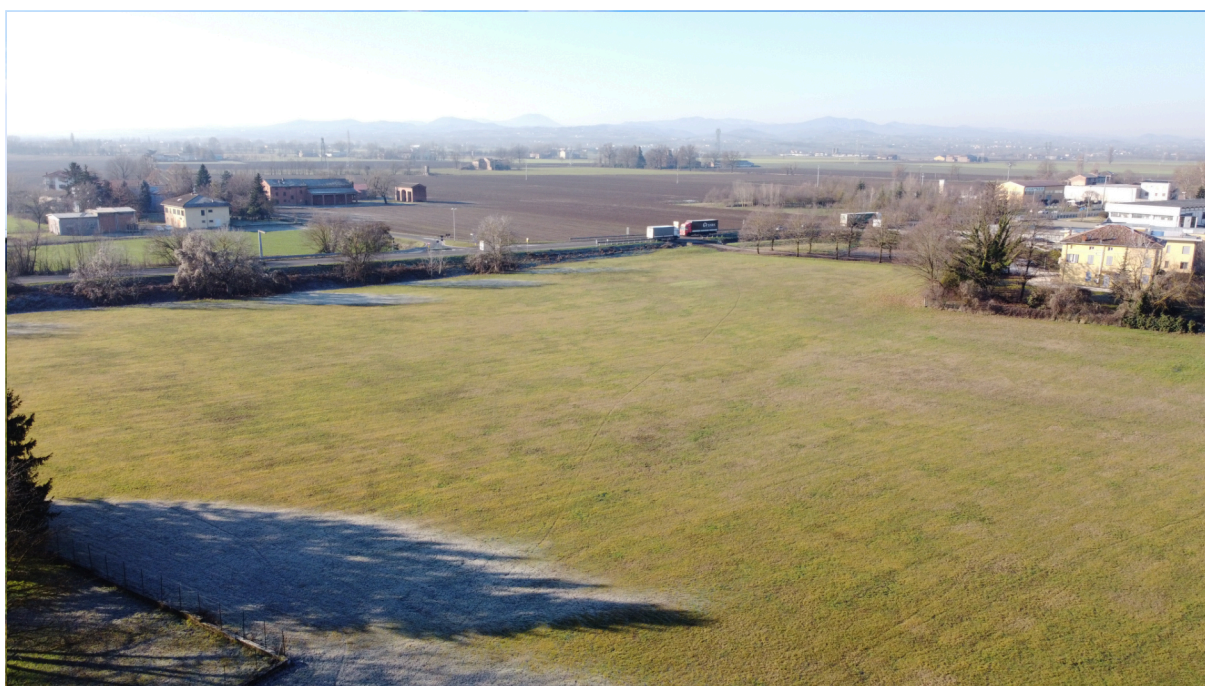
Foto aerea da nord/est