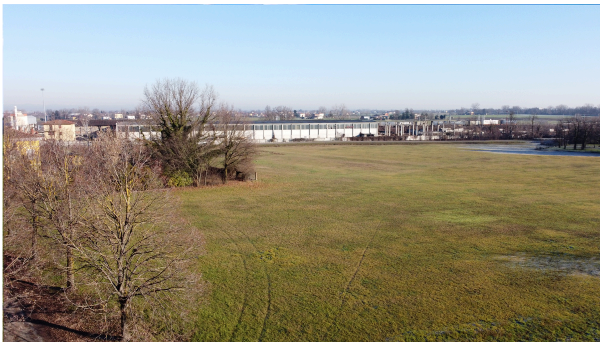
Foto aerea da sud/ovest