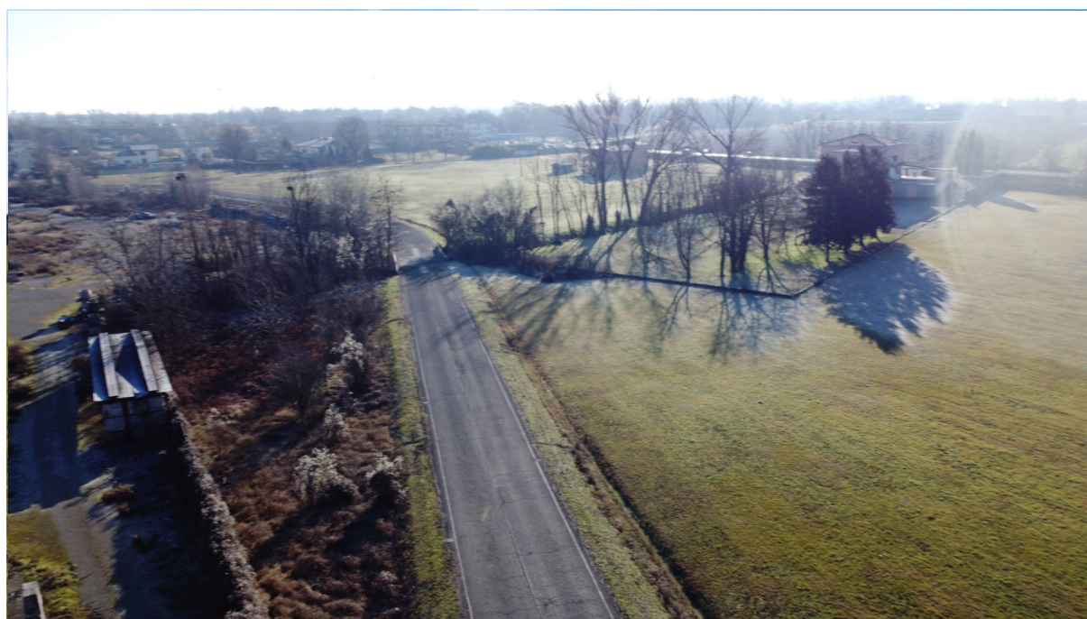
Foto aerea da ovest