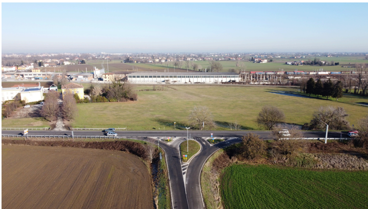
Foto aerea da sud