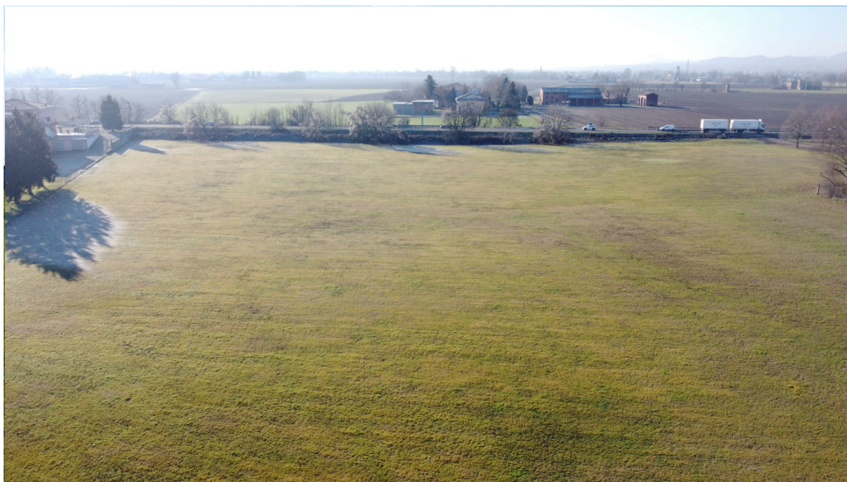
Foto aerea da nord