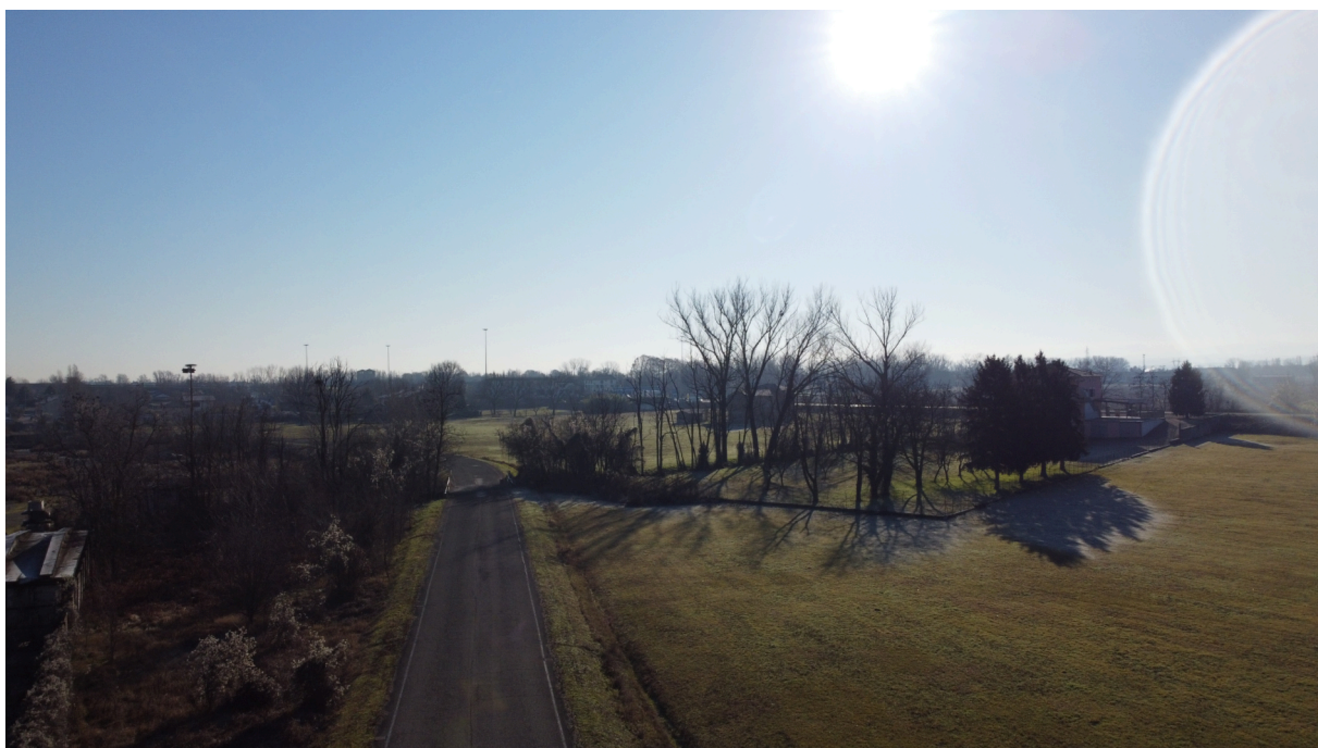
Foto aerea da ovest